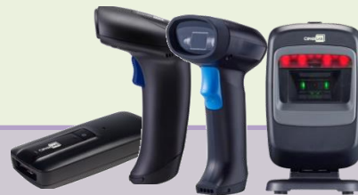
讀取及掃描周邊裝置